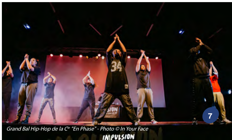
Grand Bal Hip-Hop de la C e "En Phase" - Photo © In Your Face

Nous avons hâte de vous retrouver sur le dance floor pour partager avec vous des moments de musique vivante, sous les étoiles.