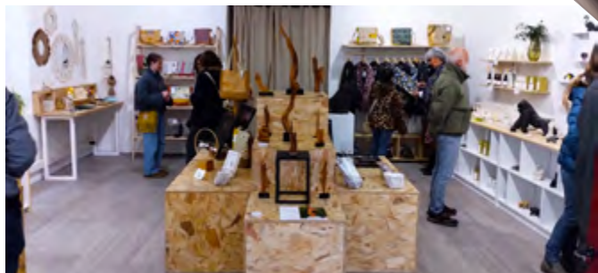
Les Pépites du 31, la nouvelle boutique de la rue des Déportés

Dédiée à la création contemporaine, La Manufacture des Arts , 17 chemin des Vivandes (anciens bâtiments de l'usine de pâtes de fruit de Nyons) est un véritable laboratoire de création. Lieu modulable, il favorise l'expérimentation artistique. Ses expositions temporaires, conférences, résidences d'artiste et ateliers participatifs salutaires, vous invitent à renouer avec l'imaginaire par le geste artistique. À deux pas de là, au 63 rue de la Maladrerie, Les 3 Platanes réunissent dans une cour ombragée plusieurs