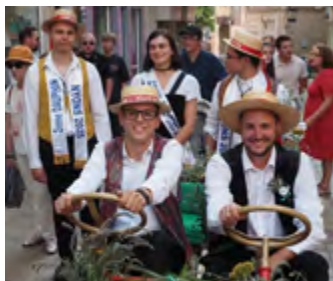
Défilé du Comité des Fêtes et des Loisirs

Organisées par la Confrérie des Chevaliers de l'Olivier, en partenariat avec la municipalité et l'Institut du Monde de l'Olivier, les Olivades vous invitent à la découverte de l'olive de Nyons du 16 au 18 juillet.