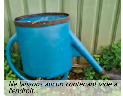
Ne laissons aucun contenant vide à l'endroit.