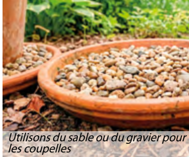
Utilisons du sable ou du gravier pour les coupelles