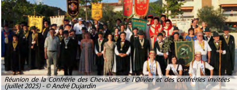
Réunion de la Confrérie des Chevaliers de l'Olivier et des confréries invitées (juillet 2025)