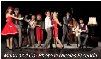
Manu and Co