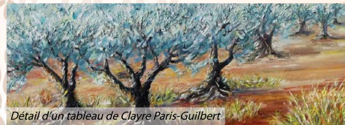
Détail d'un tableau de Clayre Paris-Guilbert