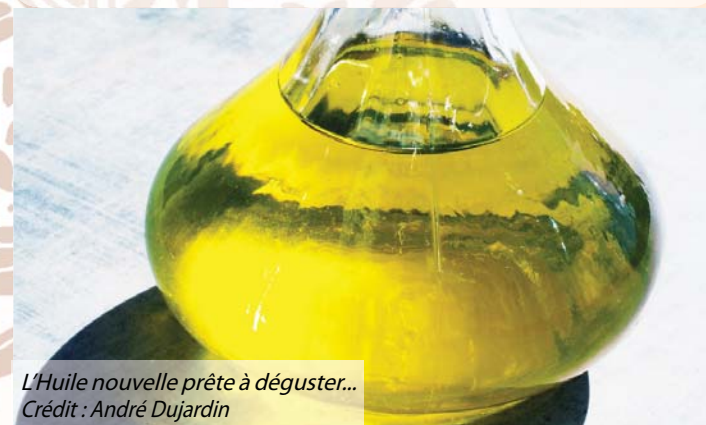
L'Huile nouvelle prête à déguster...