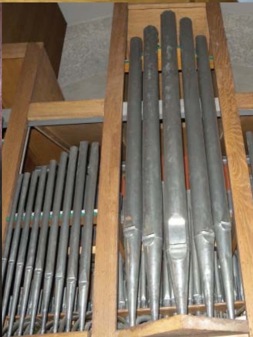
Détails de l'orgue de Nyons avant rénovation.