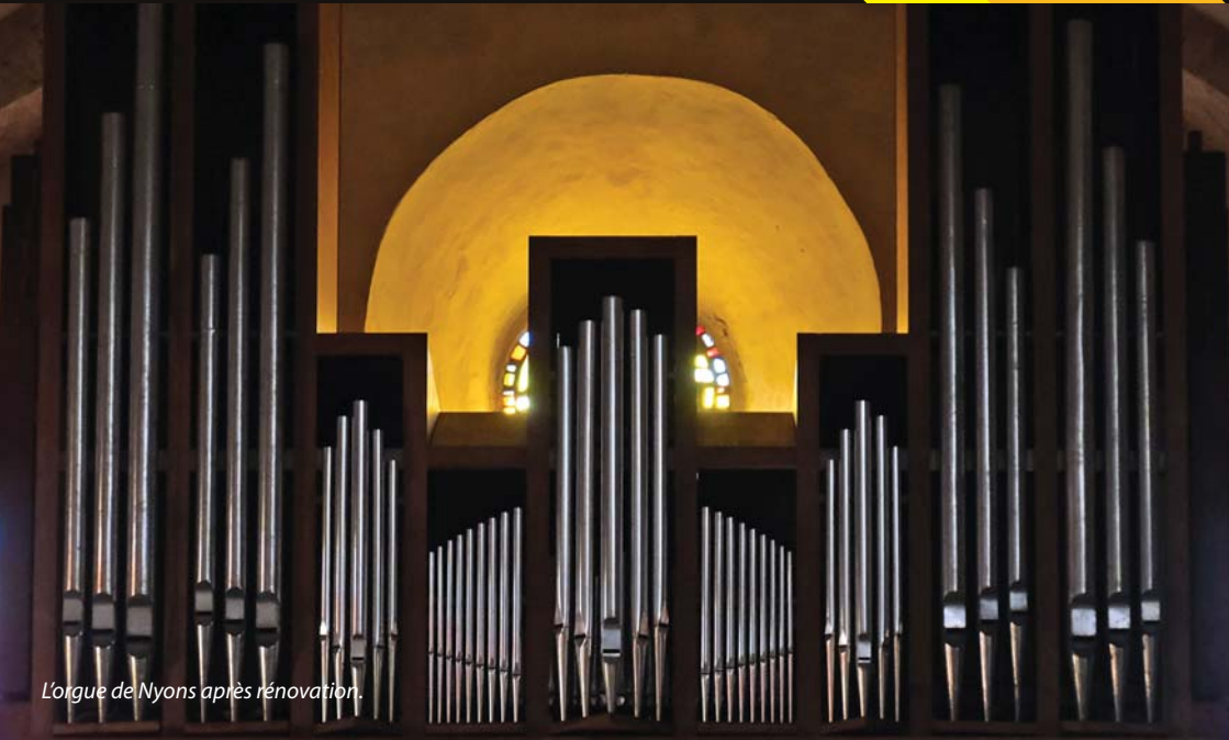
L'orgue de Nyons après rénovation.