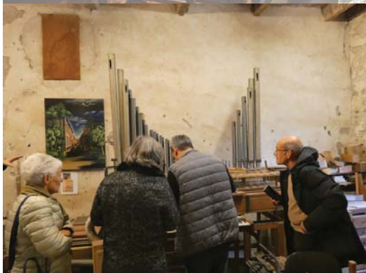
Réglage des flûtes.