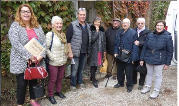
Visite de la Manufacture Languedocienne des Grandes Orgues.