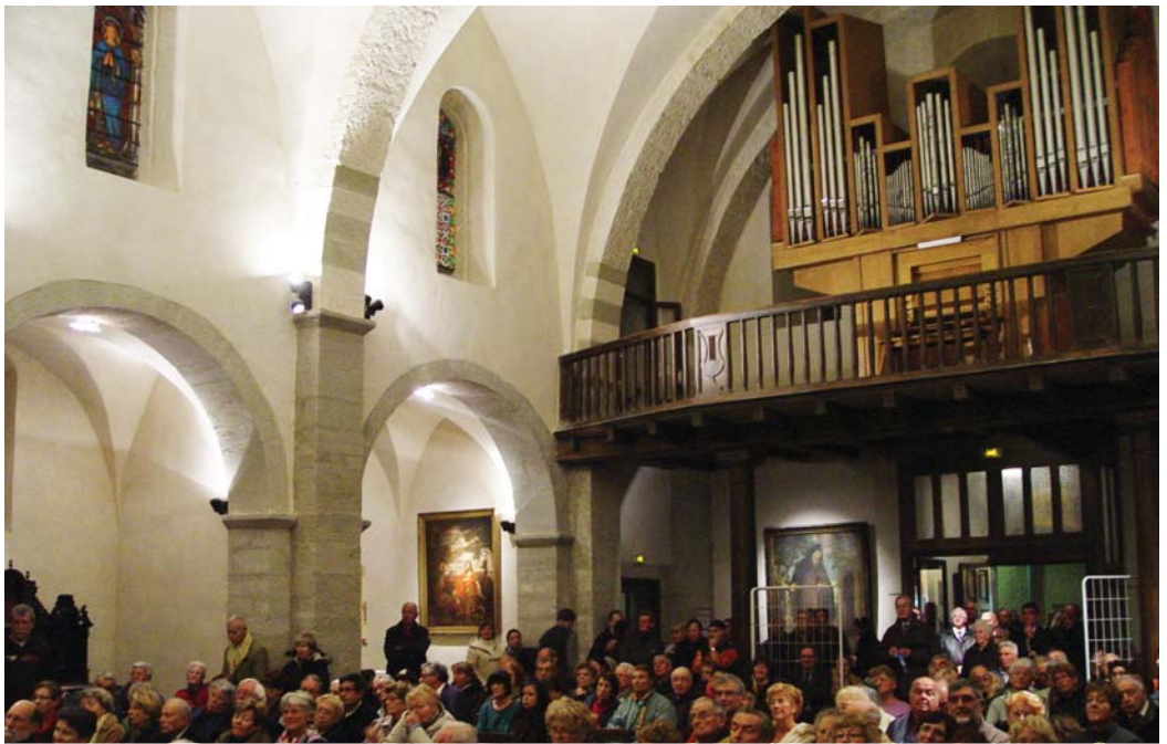
Orgue en 2010 à l'occasion d'une manifestation culturelle dans l'Église.