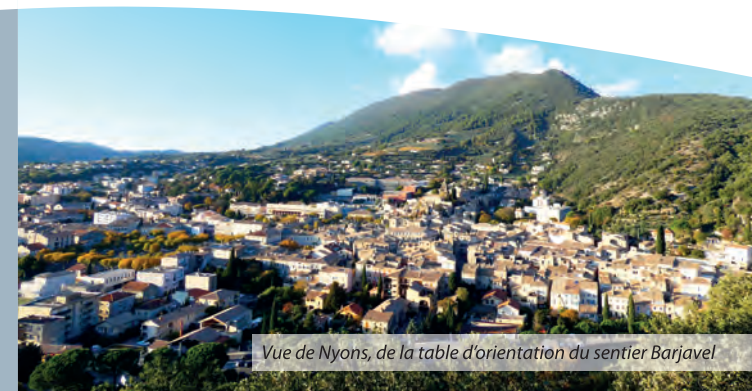
Vue de Nyons, de la table d'orientation du sentier Barjavel

Livret des sentiers «Découverte de Nyons et des environs», disponible en Mairie et à l'Office de Tourisme des Baronnies en Drôme Provençale.